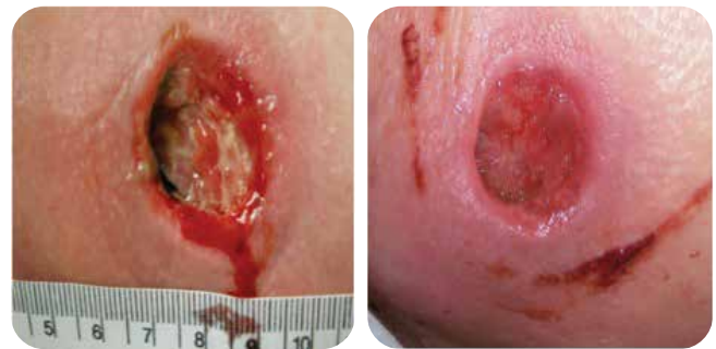
Amélioration du contour de la plaie à l'intérieur d'une semaine.

Eau et glycérol permettent au pansement d'hydrater la plaie et la peau environnante.